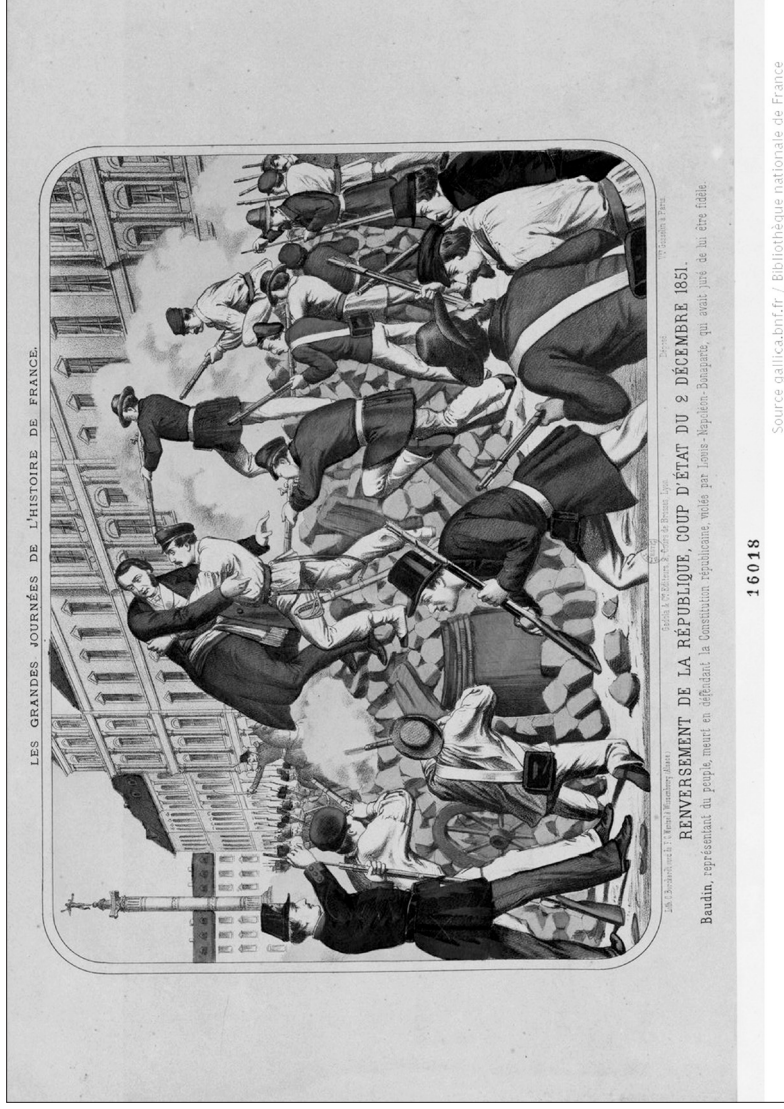
Εικ. 2: Ανατροπή της Δημοκρατίας, πραξικόπημα της 2 Δεκεμβρίου 1851. Ο Baudin, αντιπρόσωπος του λαού, πεθαίνει υπερασπιζόμενος το σύνταγμα της Δημοκρατίας, το οποίο παραβιάστηκε από τον Λουδοβίκο Βοναπάρτη που είχε ορκιστεί να είναι πιστός σ' αυτό. (Χρωμολιθογραφία)