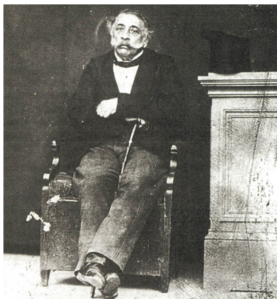
Αλέξανδρος Μαυροκορδάτος. Φωτογραφία του Φίλιππου Μαργαρίτη. Εθνική Πινακοθήκη - Μουσείο Αλέξανδρου Σούτζου. Δημοσιεύεται στο Άλκης Ξανθάκης (επιμ.), Φίλιππος Μαργαρίτης. Ο πρώτος έλληνας φωτογράφος , Αθήνα 1990, σ. 43.